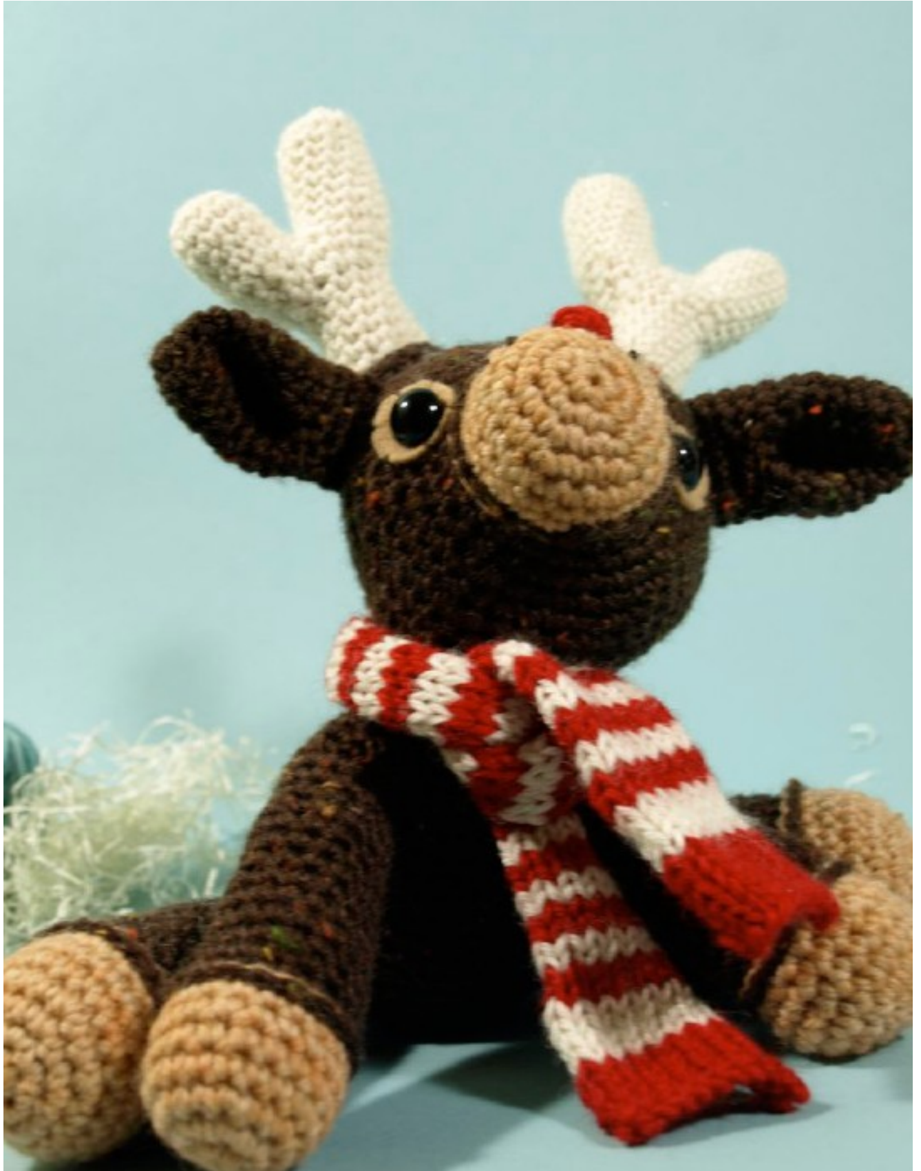
Fig 7: Dawn's Murray (the merry) reindeer (@ Dawn Toussaint )