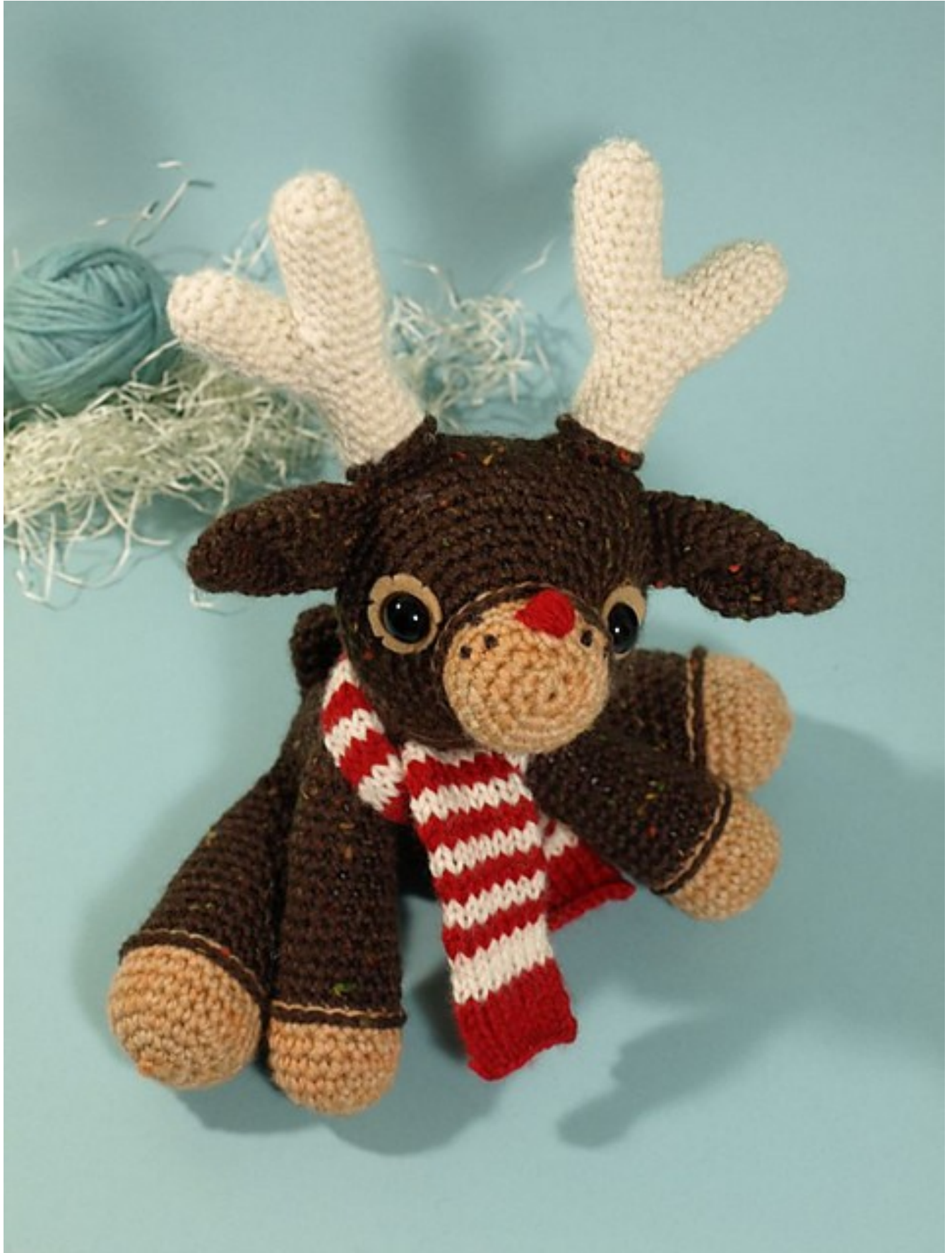
Fig 5: Dawn's Murray (the merry) reindeer ( ©Dawn Toussaint )