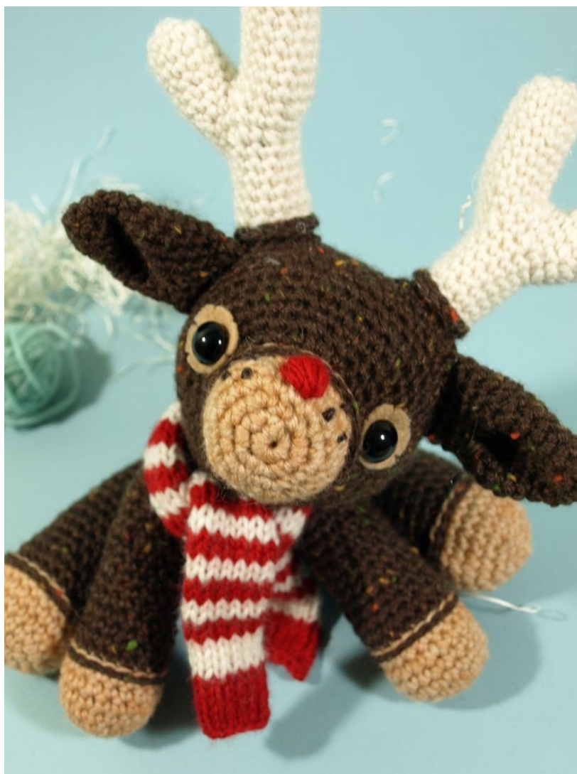
Fig 1: Dawn's Murray (the merry) reindeer (@ Dawn Toussaint )

http://dawntoussaint.blogspot.com/2010/11/murray-merry-reindeer.html