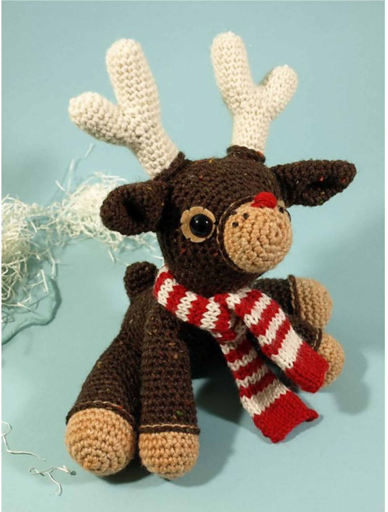
Fig 6: Dawn's Murray (the merry) reindeer