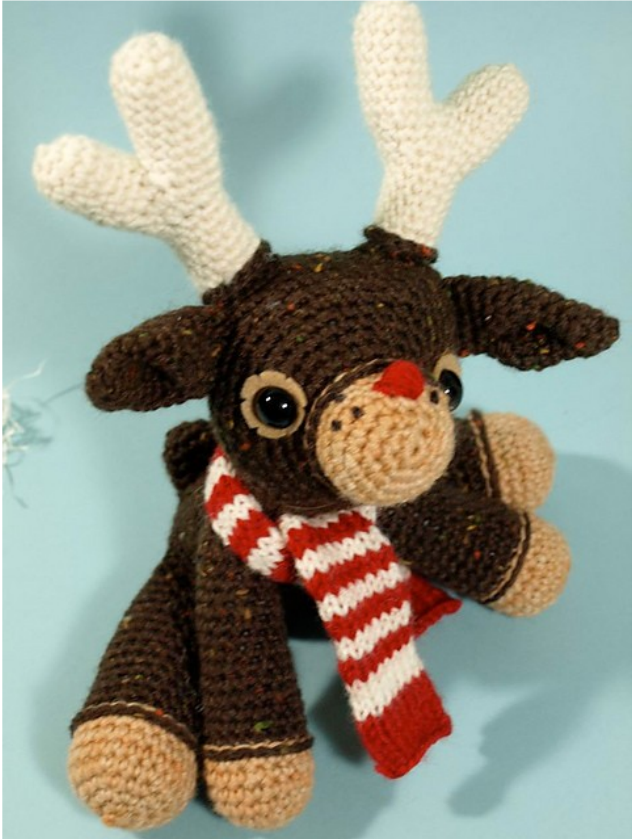
Fig 4: Dawn's Murray (the merry) reindeer