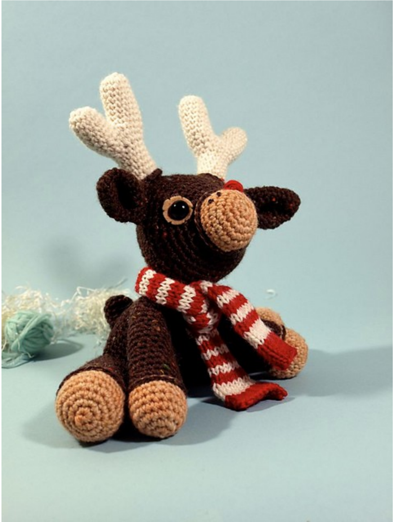
Fig 9: Dawn's Murray (the merry) reindeer