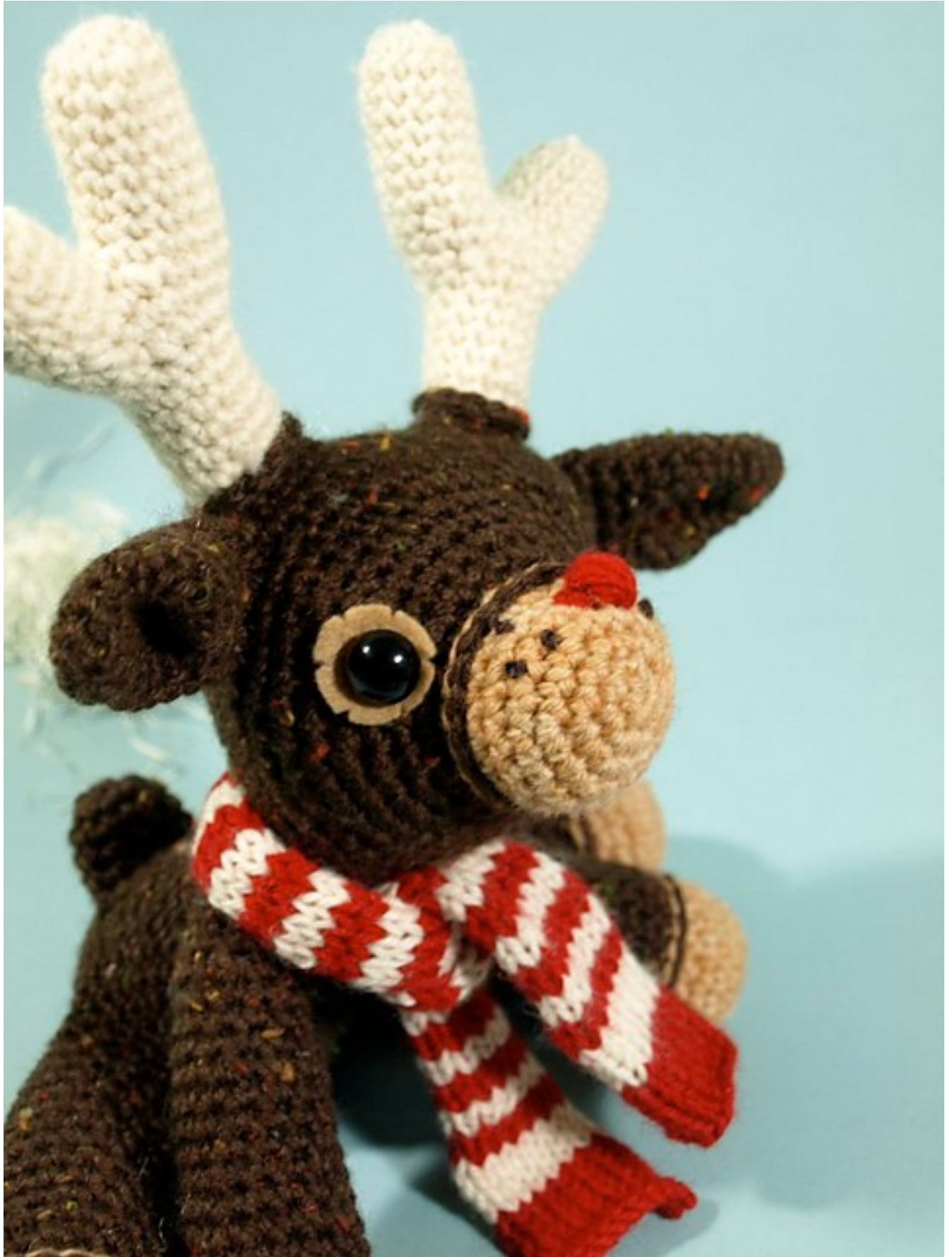
Fig 8: Dawn's Murray (the merry) reindeer