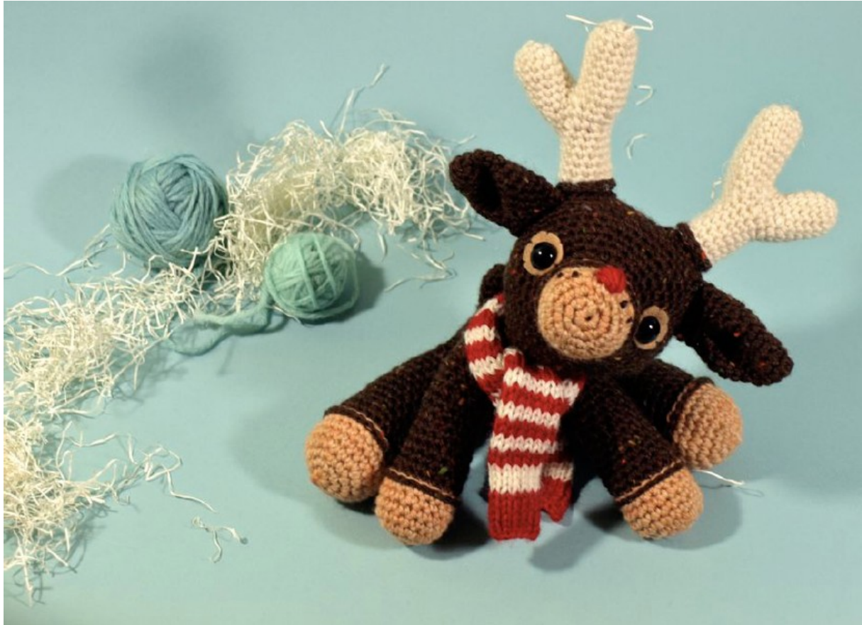
Fig 2: Dawn's Murray (the merry) reindeer