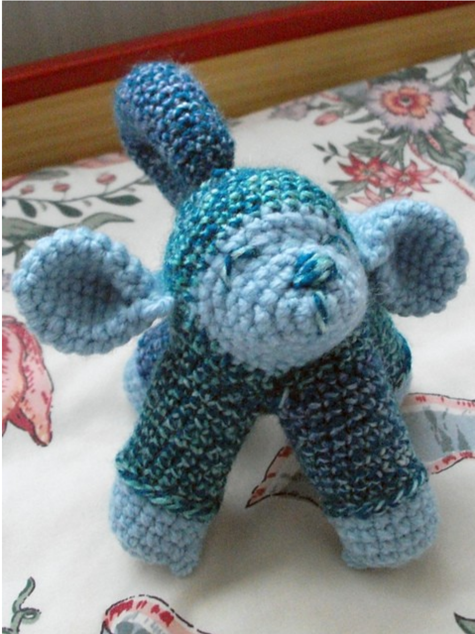
Fig 7: Mijn Manuel