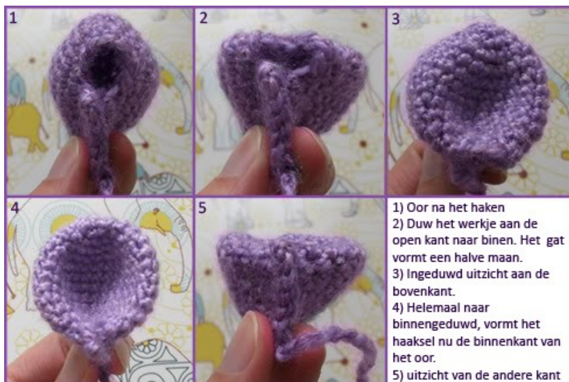
Fig 6: Hoe het oor te vormen (@Charami)