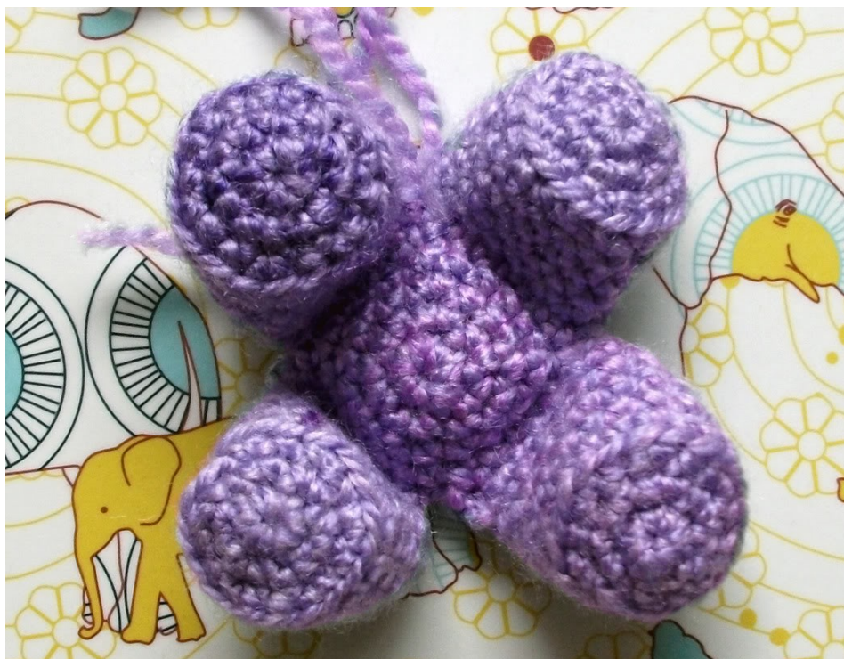
Fig 3: Onderkant van de buik met poten van Padma de olifant