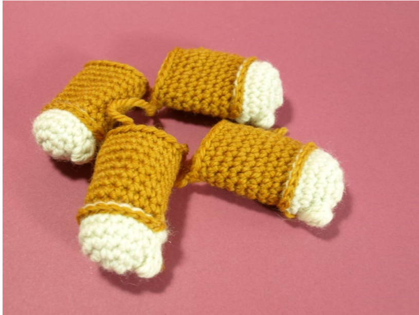
Fig 2: 4 poten met Bobble die duim vormt