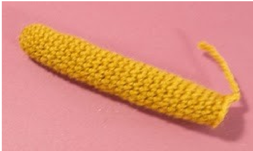
Fig 4: de staart (@Dawn Toussaint)