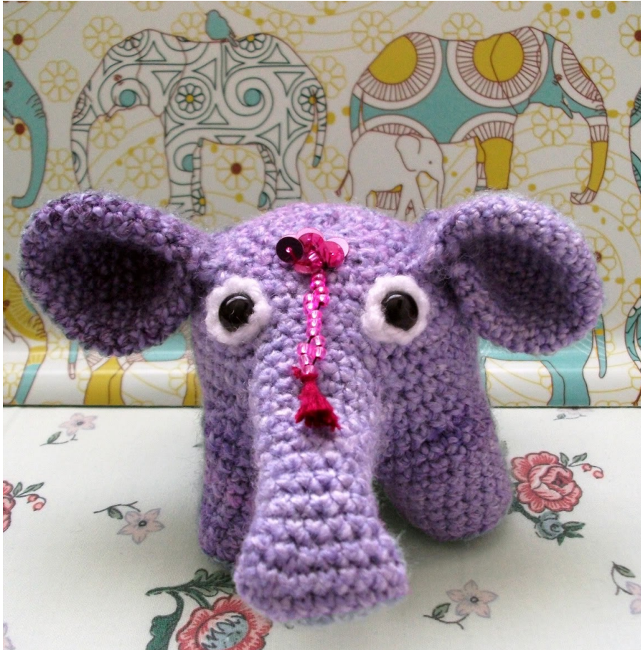
Fig 7: Mijn Padma