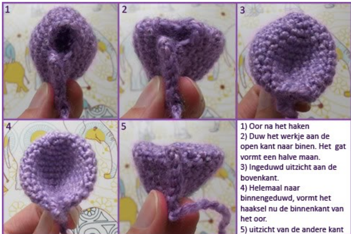
Fig 6: Hoe het oor te vormen (@Charami)