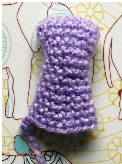
Fig 5 (rechts): Bovenkant van slurf