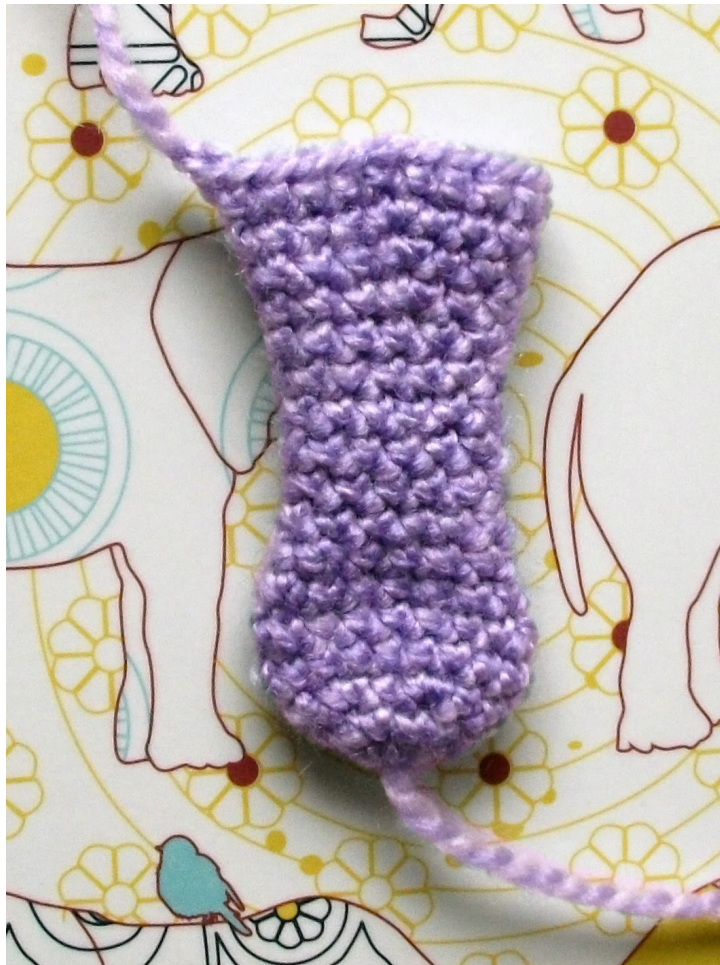
Fig 3: Platgedrukte slurf voor het oprollen