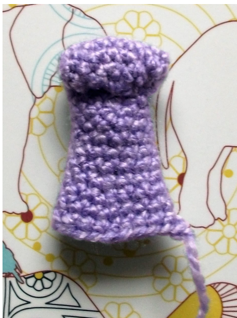
Fig 4 (links): Onderkant van slurf