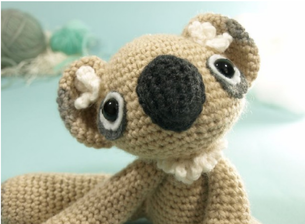
FIG 1: Dawn's Neila de Koala (© Dawn Toussaint )

http://dawntoussaint.blogspot.com/2011/05/may-cal-its-neila-koala.html